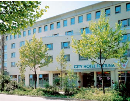
City Hotel Fortuna Am Echazufer 22 72764 Reutlingen