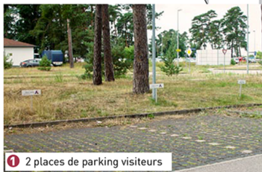
1 2 places de parking visiteurs